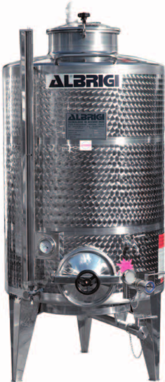
I Minitank termo "S" da 1000 completa di tutti gli accessori