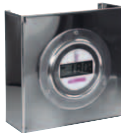
I Termometro digitale