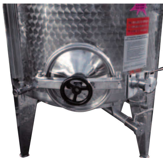
I Portella ø 300 mm posta a filo fondo