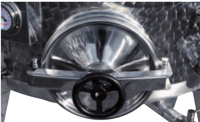
I Portella ø 300 mm filo fondo apertura esterna