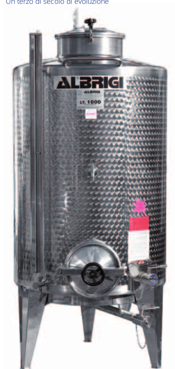
I Minitank "S" completo di tutti gli accessori da lt 1000