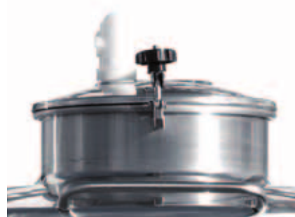
I Vista di chiusino ø 400 mm con coperchio apertura a bandiera