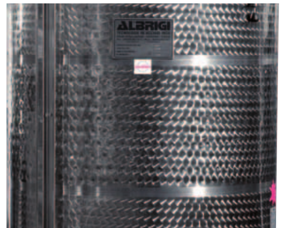
I Intercapedine di condizionamento centrale Termostar