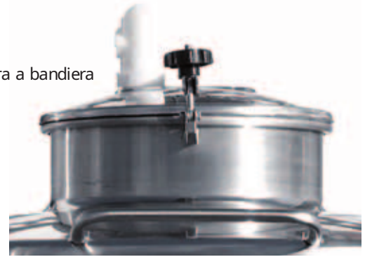
I Chiusino ø 400 mm apertura a bandiera