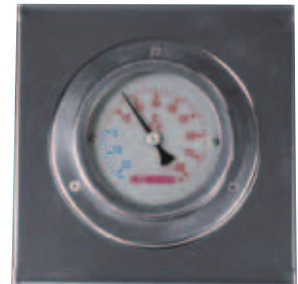
I Termometro analogico