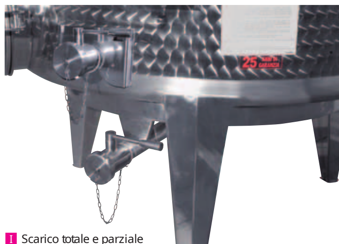
I Scarico totale e parziale