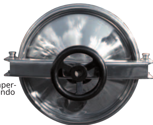
I Portella ø 300 mm apertura esterna a filo fondo