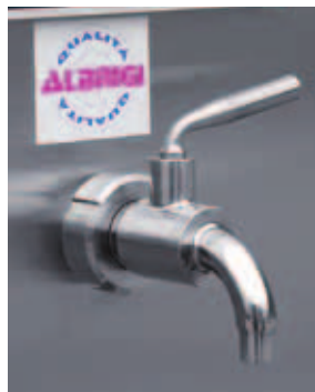
I Preleva campioni inox con attacco din e chiusura a sfera